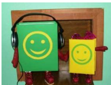
«Книжулики» в фойе библиотеки