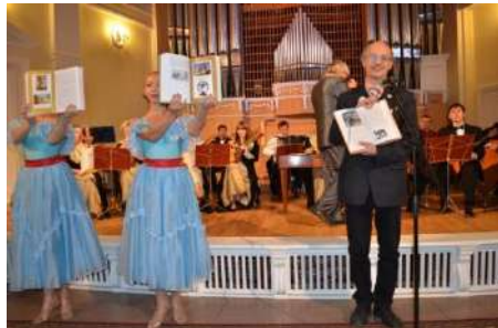
На открытии Фестиваля были подведены и итоги областного детского конкурса на лучшую краеведческую экскурсию, рисунок «Приезжайте посмотреть»