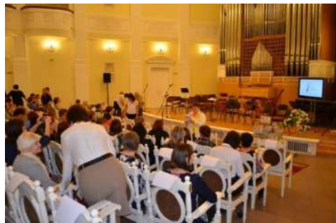
Торжественное открытие Фестиваля