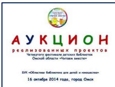
Слайд-заставка деловой игры