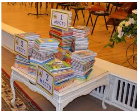
Призы победителям – книги