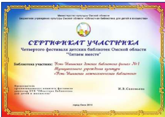
Диплом и сертификат участника