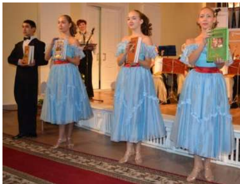
Открытие Фестиваля в Зале органной и камерной музыки – видеоряд на экране, церемониальная группа