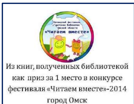
Наклейка на «призовые» книги