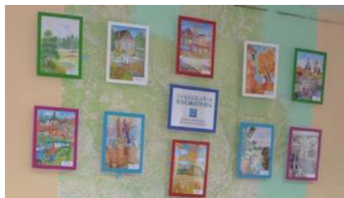
Фотовыставка в литературной гостиной библиотеки