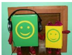
«Книжки» - символ библиотеки