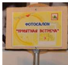
Фотосалон в фойе театра