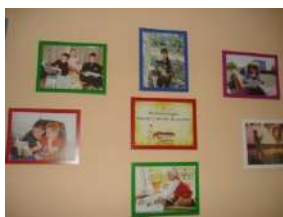
Фотовыставка в литературной гостиной библиотеки