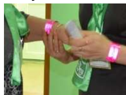
Цветные магнитные браслеты