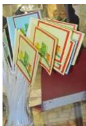
Флажки, бейджи, листовки